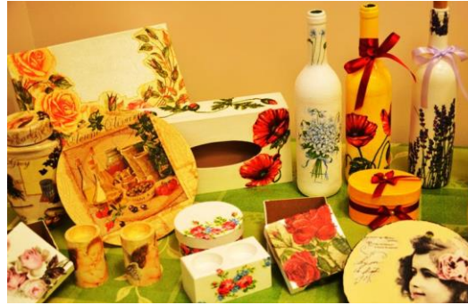
Pracownia rękodzieła artystycznego: